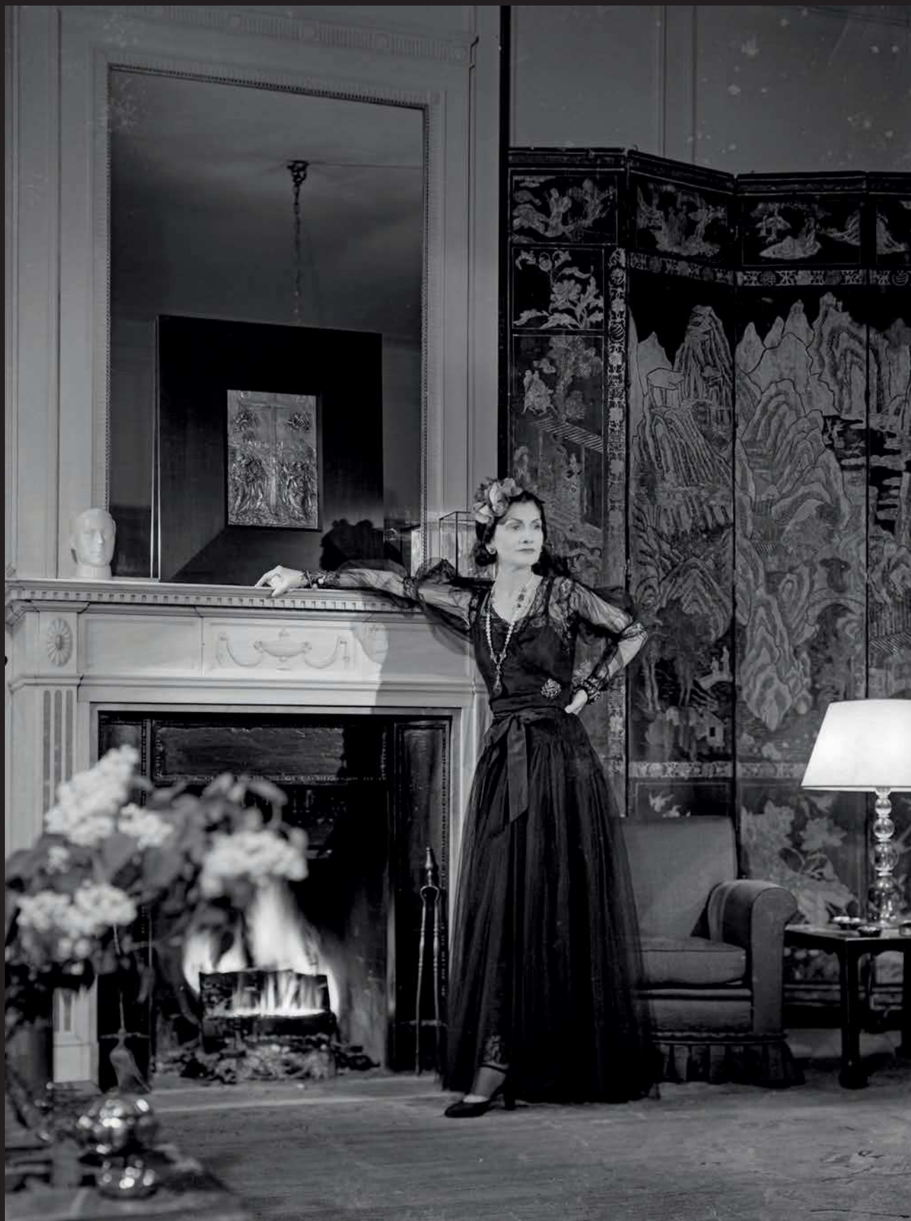
ill.1 Gabrielle Chanel, photographie de François Kollar publiée dans Harper's Bazaar , novembre 1937 (publicité pour les Parfums Chanel).