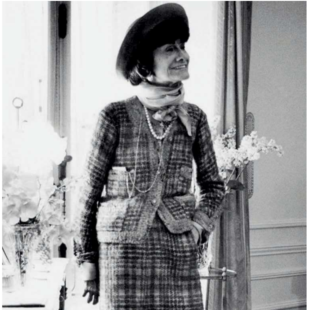
ill. 6 Gabrielle Chanel en 1965, photographie de Hatami.