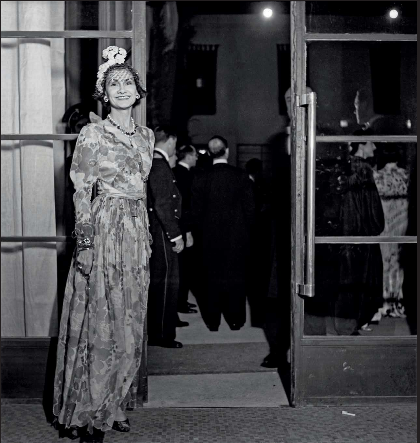
ill.1 Gabrielle Chanel en 1937