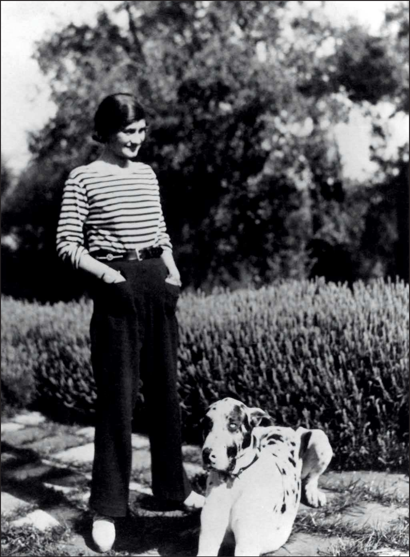
iii.1 Gabrielle Chanel à la villa La Pausa, à Roquebrune, avec son chien Gigot, 1930, photographie Granger.