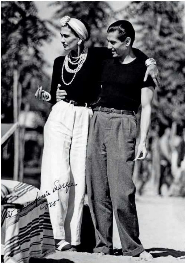
ill. 4 Gabrielle Chanel et Serge Lifar, le Lido, Venise, 1937, dédiée par Chanel à Lifar.