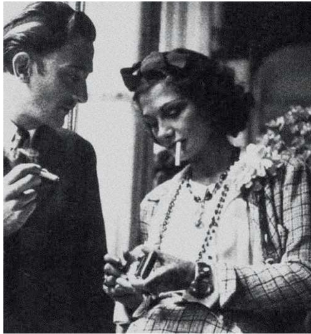
ill. 5 Gabrielle Chanel et Salvador Dalí, dans les années 1930.