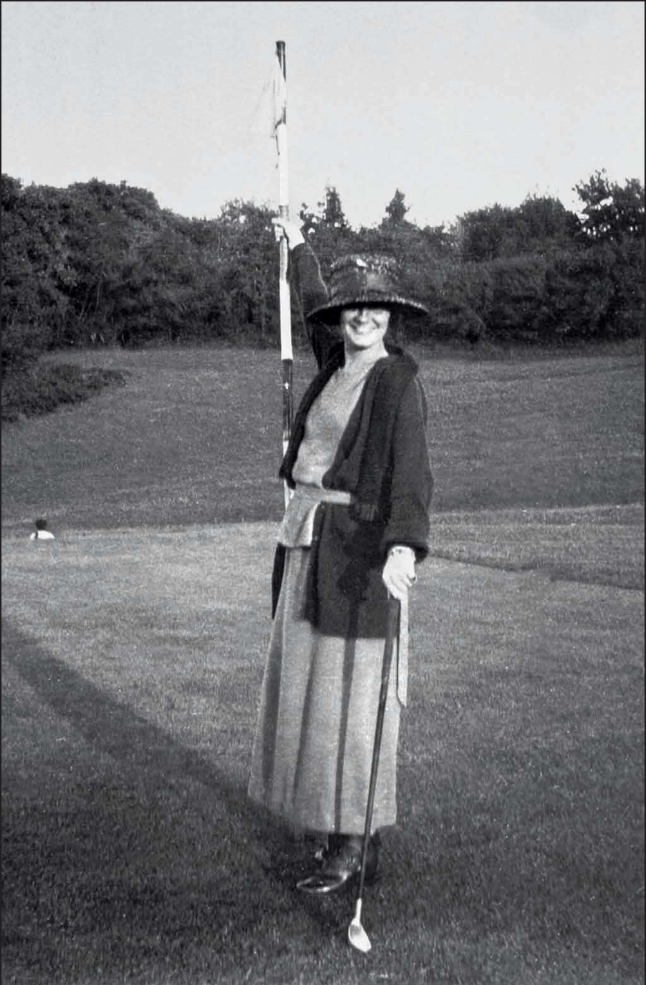
iii.1 Gabrielle Chanel jouant au golf à Saint-Jean-de-Luz en 1910.