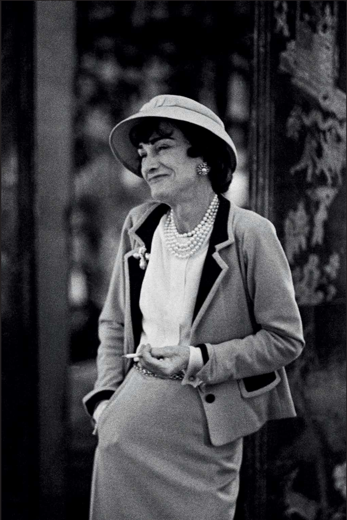
iii.1 Gabrielle Chanel